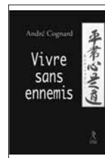
Vivre sans ennemis 14.- Euros