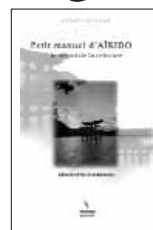
Petit Manuel d'Aïkido 26.-Euros