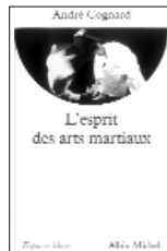
L'Esprit des arts martiaux 7.-Euros