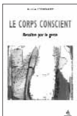
Le Corps Conscient 15.-Euros