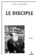
Le Disciple 14.-Euro