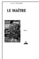
Le Maître 15.-Euros

La voie est un héritage de la tradition. En ce sens, elle transmet à la fois les valeurs initiatiques les plus propices à notre développement, ce qui dans le cadre de notre éthique s'entend forcément par des avancées vers la liberté individuelle, et des archaïsmes dont il faut la dépoussiérer pour ne pas la trahir. Ainsi, dans l'application du rituel, l'on peut voir les réminiscences d'une forme religieuse, et il est donc indispensable de dire la fonction et le sens de tels gestes. La déontologie nous interdit de proposer dans ce domaine un apprentissage aveugle.