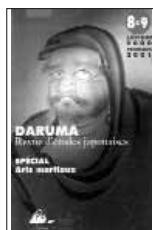
Daruma 20.- Euros