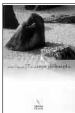
Le Corps Philosophe 26.-Euros