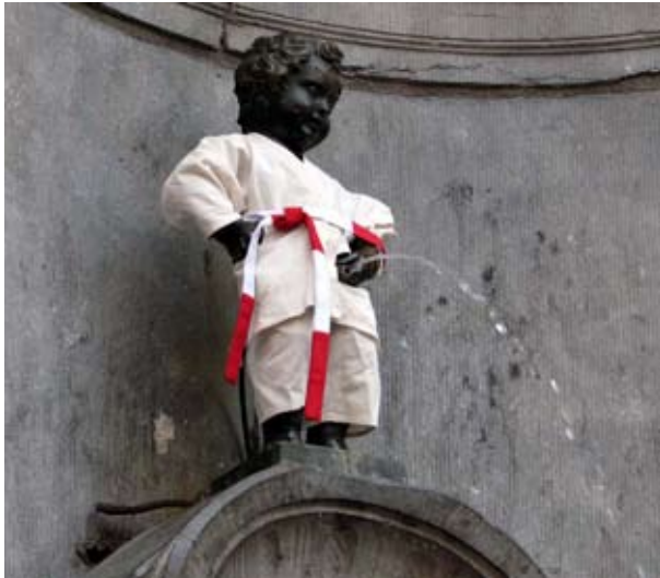
Menneken Pis, 6e dan. « La ceinture, ça sert à attacher son kimono »