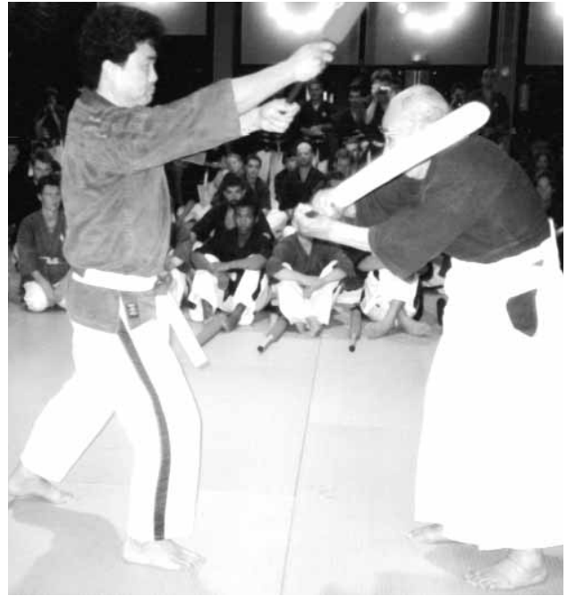
Minoru Mochizuki, en 2000, lors d'une petite démonstration.

C'est une base qui évidemment a été développée de différente manière mais qui reste fondamentalement la même. L'aïkido s'intègre tout autant dans ce système que, par exemple, le karaté