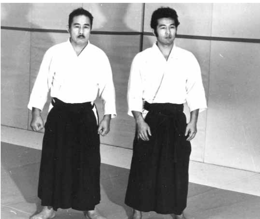
Mochizuki père et fils en 1971.

Nous avons organisé des stages internationaux en France, et à partir de là nous avons établi un système de stages dans différents pays. C'était le début. Ces karatékas de la première génération sont un peu horrifiés et ils disent des choses négatives sur moi.