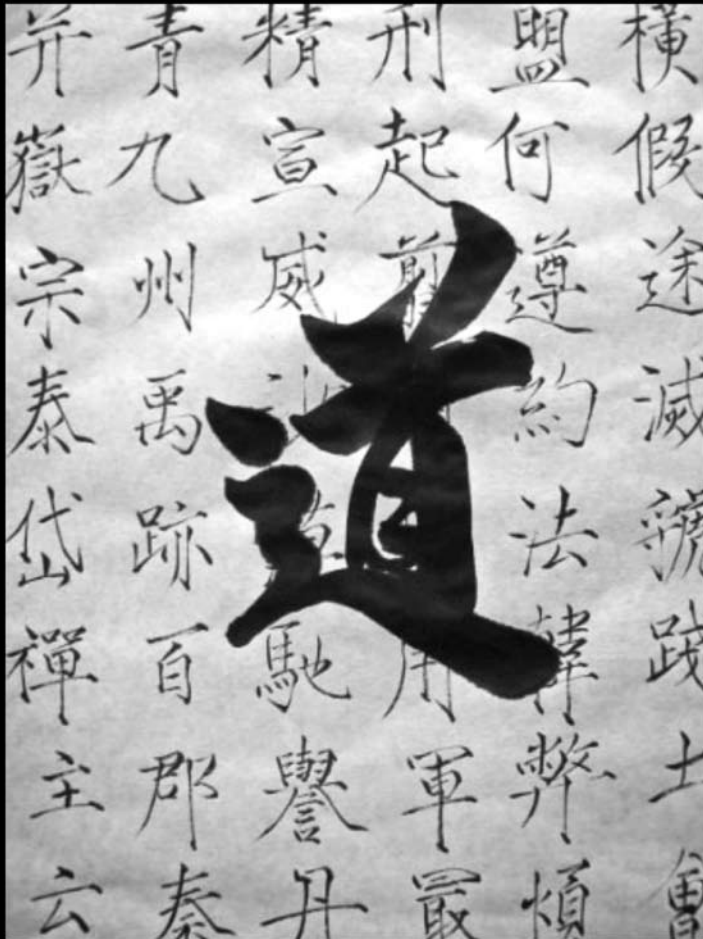
Der Hintergrund dieser Kalligraphie besteht aus Schriftzeichen in einer alten chinesischen Schrift und symbolisiert „ ki-hon “. Das große Schriftzeichen „ do “ symbolisiert die Entwicklung aus dem „ ki-hon “ – was durch regelmässiges Ueben zum Do wird (werden kann).

dann kommt die Stagnation und dann die große Verwunderung, mit dem noch größeren Warum?“