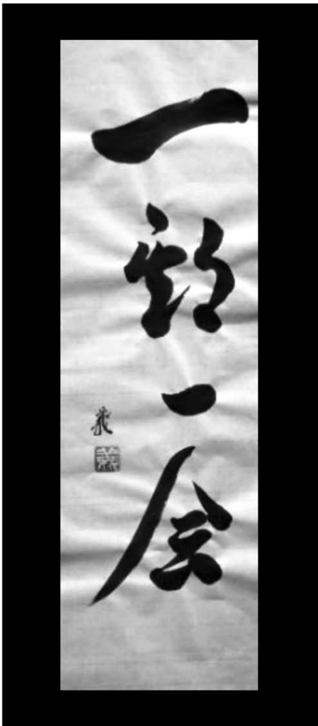
Shodo – von Georg Gallati.